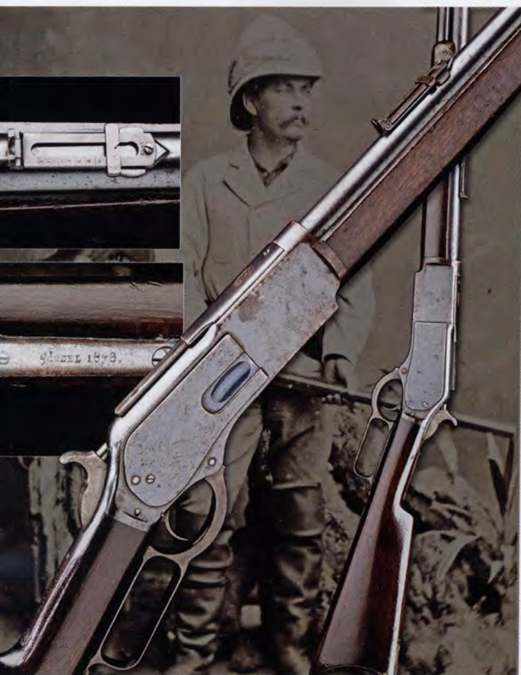
Henry Morton Stanley - ham med Dr. Livingstone - havde denne Winchester kal. .45-75 med i Afrika og brugte den flittigt. Det var en af hovedattraktionerne for samlerne. Den var forsigtigt vurderet til 15.000 pund, men opnåede en pris på 35.000 pund.