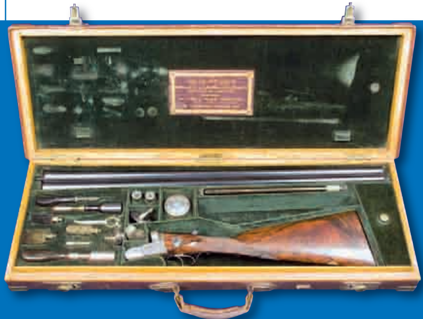
Splendida doppietta Greener "Facile Princeps" calibro 12 brevetto 1880 completa di cassetta foderata in velluto verde, condizioni splendide. Prezzo di partenza 5.000 sterline