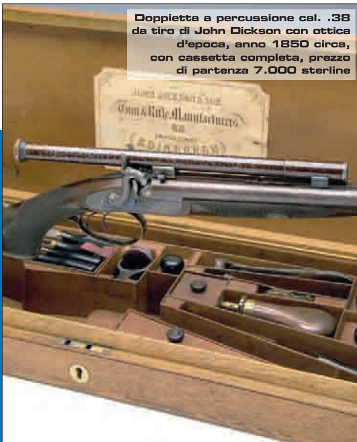
Doppietta a percussione cal. .38 da tiro di John Dickson con ottica d'epoca, anno 1850 circa, con cassetta completa, prezzo di partenza 7.000 sterline

A ogni evento, organizzato nella sede di Princess Louise House, nella >>>